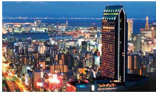
▶ ANAクラウンプラザホテル神戸