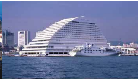
▶ 神戸メリケンパークオリエンタルホテル