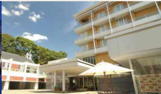
▶ ホテル北野プラザ六甲荘